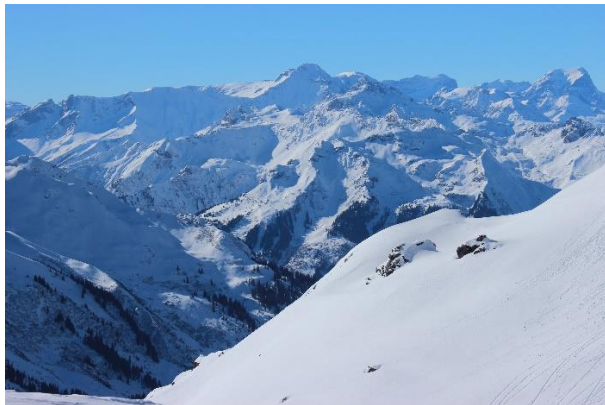
Blick auf Hausstock und Tödi (rechts)

Weit gleitet unser Blick vom Gipfel in die majestätischen Glarnerberge im Süden bis in die Churfürsten im Norden. Diese Rundtour ist mit 800 Höhenmetern eher für sportliche Schneeschuhläufer geeignet.