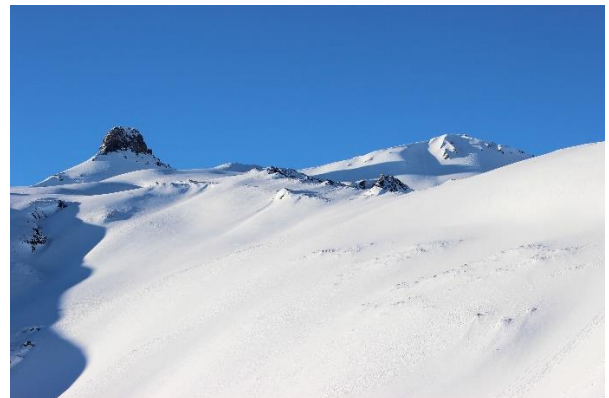
Spitzmilten (links) und Wissmilten

Aufgrund der Zugsunterbrechung im Rheintal fahren wir mit dem Auto in die Flumserberge.